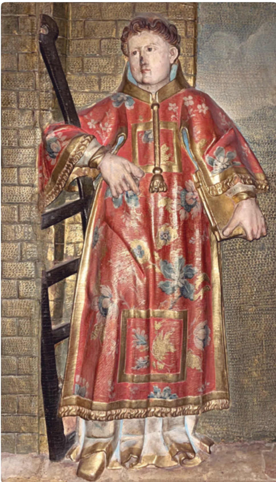
Fragment de retaule amb Sant Llorenç, 1a meitat del segle XVII - Procedent de l'església de Sant Miquel de Cardona - MDCS 309-4