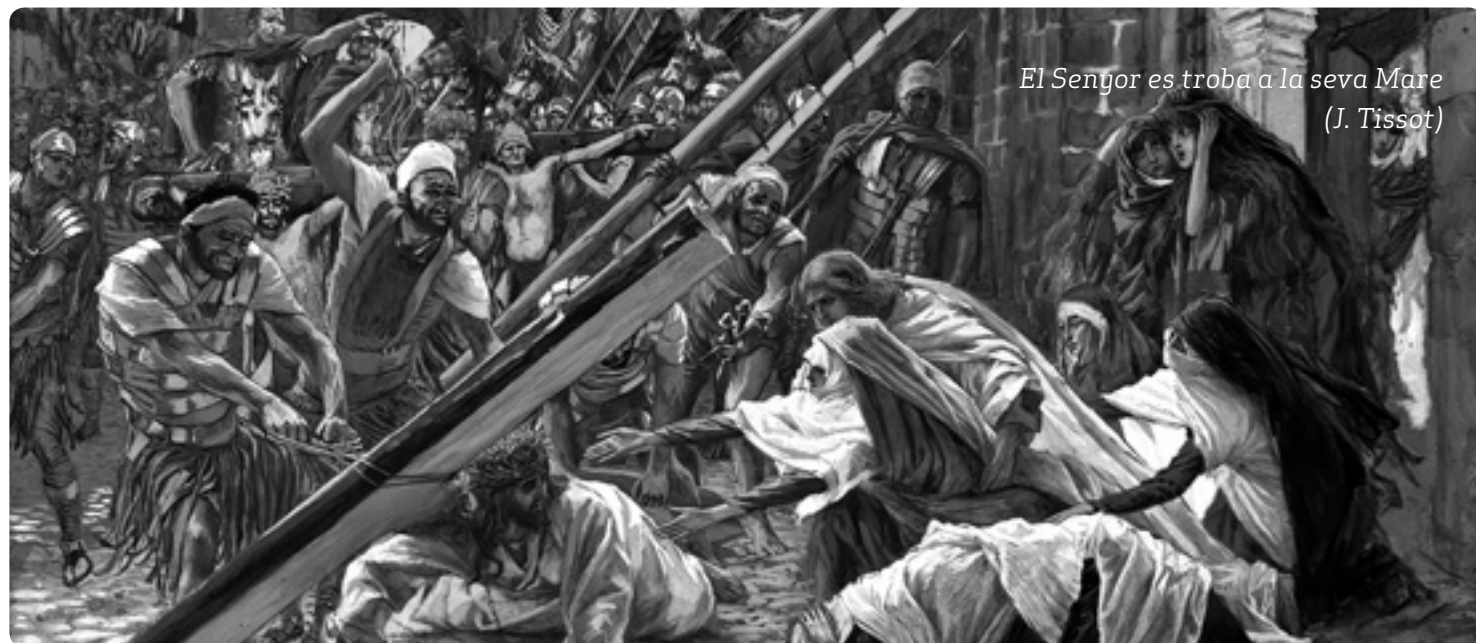
El Senyor es troba a la seva Mare (J. Tissot)