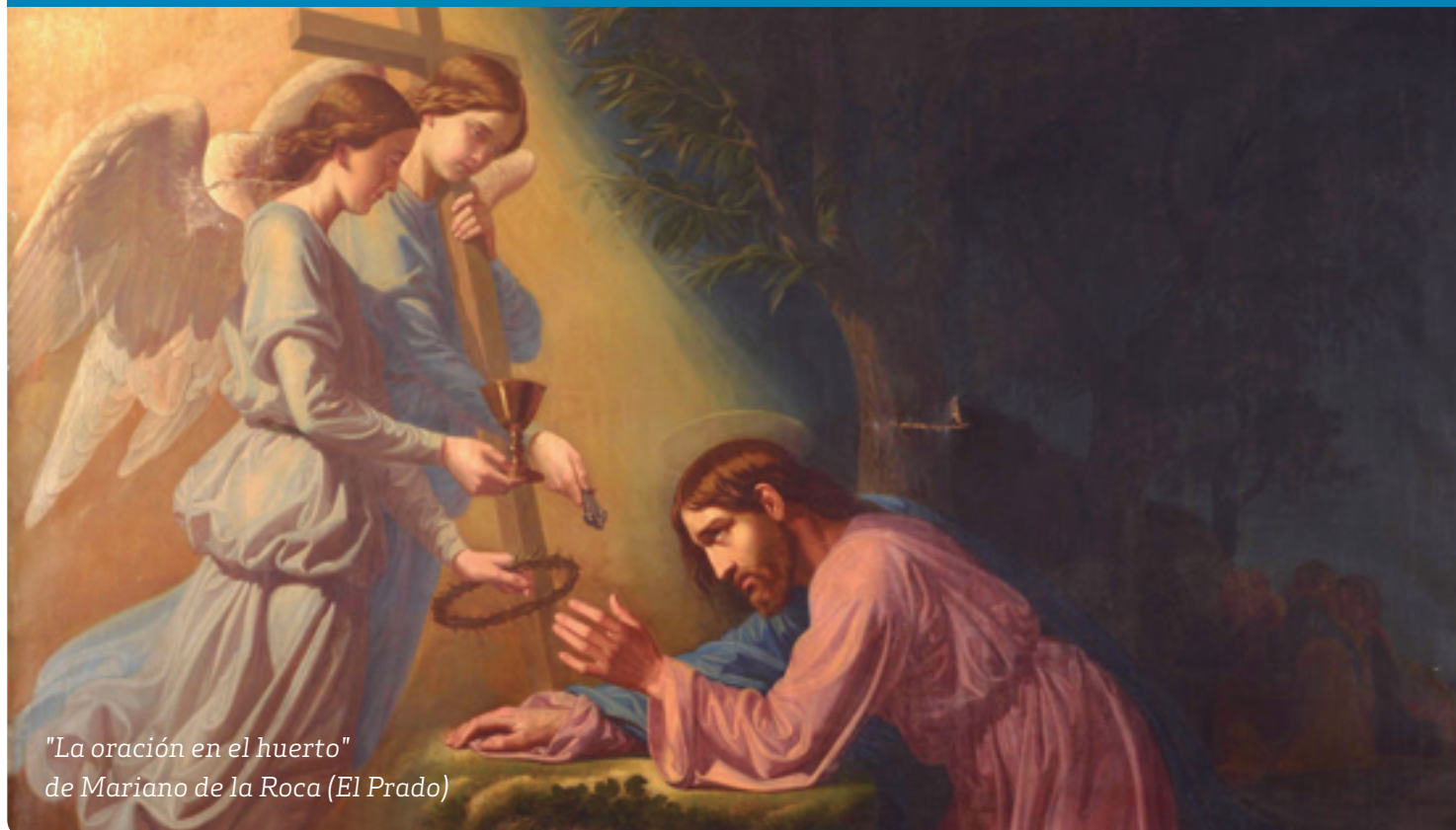
"La oración en el huerto" de Mariano de la Roca (El Prado)