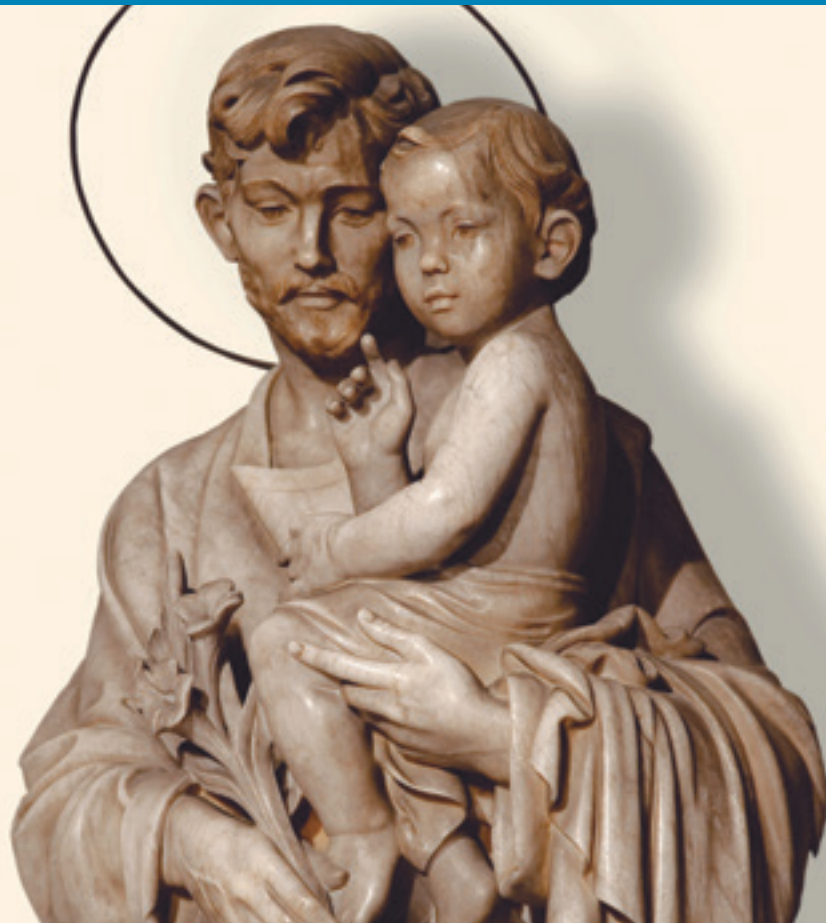
Sant Josep Monestir de Sant Joan de les Abadesses. Escultura de Josep Viladomat.

p6 – Històrica visita del Sant Pare a l'Iraq