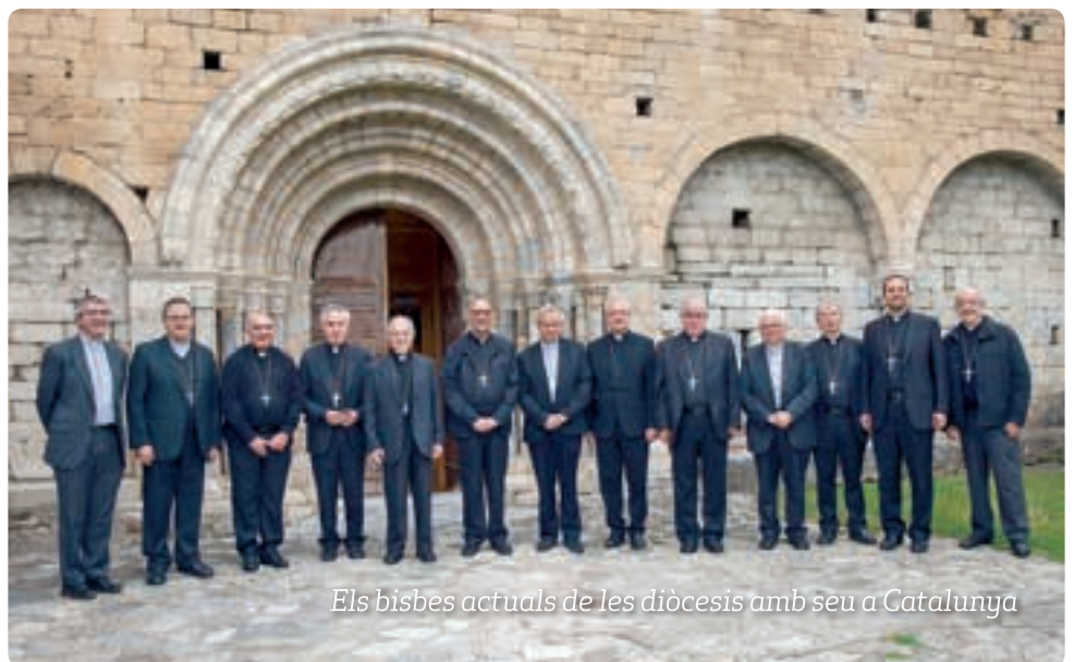
Els bisbes actuals de les diòcesis amb seu a Catalunya

El concili fou clausurat solemnement a la catedral de Tarragona el 4 de juny de 1995. En compliment de les disposicions canòniques, els bisbes varen presentar al Sant Pare les 170 resolucions conciliars en ordre al degut «reconeixement» ( recognitio ), previ a la publicació. A causa del retard en la resposta de la cúria romana, es va originar un notable malestar en els ambients eclesials que havien treballat i seguit el desenvolupament del concili. A la cúria romana van dir que el retard era degut al fet que les resolucions es varen sotmetre a l'estudi de diversos dicasteris, perquè donessin el seu parer, sobre les resolucions de la seva competència pròpia de cada dicasteri, i que això havia demorat la resposta. De tota manera, l'aprovació de Roma va arribar el juny de 1996, un any després de la clausura del nostre concili provincial.