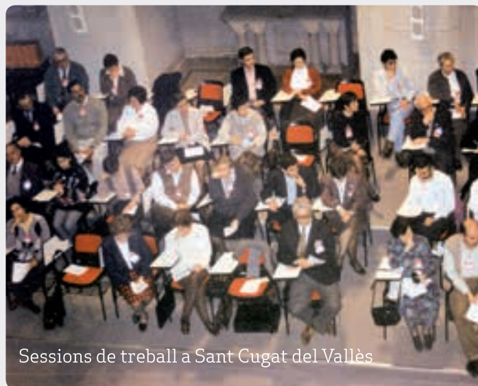
Sessions de treball a Sant Cugat del Vallès

Sentir el dolor de tantes persones que sofreixen per causa del que sigui, però sobretot d'aquelles persones que no tenen les condicions indispensables per a viure dignament.