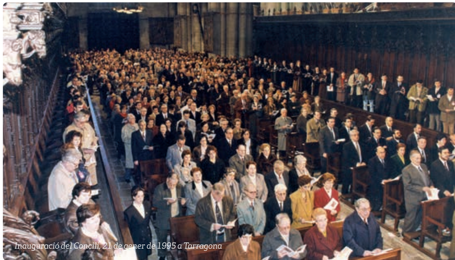
Inauguració del Concili, 21 de gener de 1995 a Tarragona

Situat en la llarga història dels concilis provincials de la Tarraconense, el concili provincial de 1995 fou anunciat per l'arquebisbe metropolità de Tarragona, Ramon Torrella Cascante, al monestir cistercenc de Poblet l'any 1992. Fou inaugurat a la catedral de Tarragona el 21 de gener de 1995. Aquest dia el calendari cristià celebra una festa molt entrañable a la Tarraconense: la dels màrtirs sants Fructuós, bisbe, i els seus diaques Auguri i Eulogi, els primers màrtirs cristians coneguts i documentats de la Hispània romana. El de 1995 fou el primer concili provincial celebrat després del Concili Ecumènic Vaticà II (1962-1965). Des del primer moment el va presidir una doble intenció: reprendre la llarga tradició sinodal expressada en els concilis provincials tarraconenses i insistir en l'aplicació de les reformes del Concili Vaticà II a les nostres diòcesis.