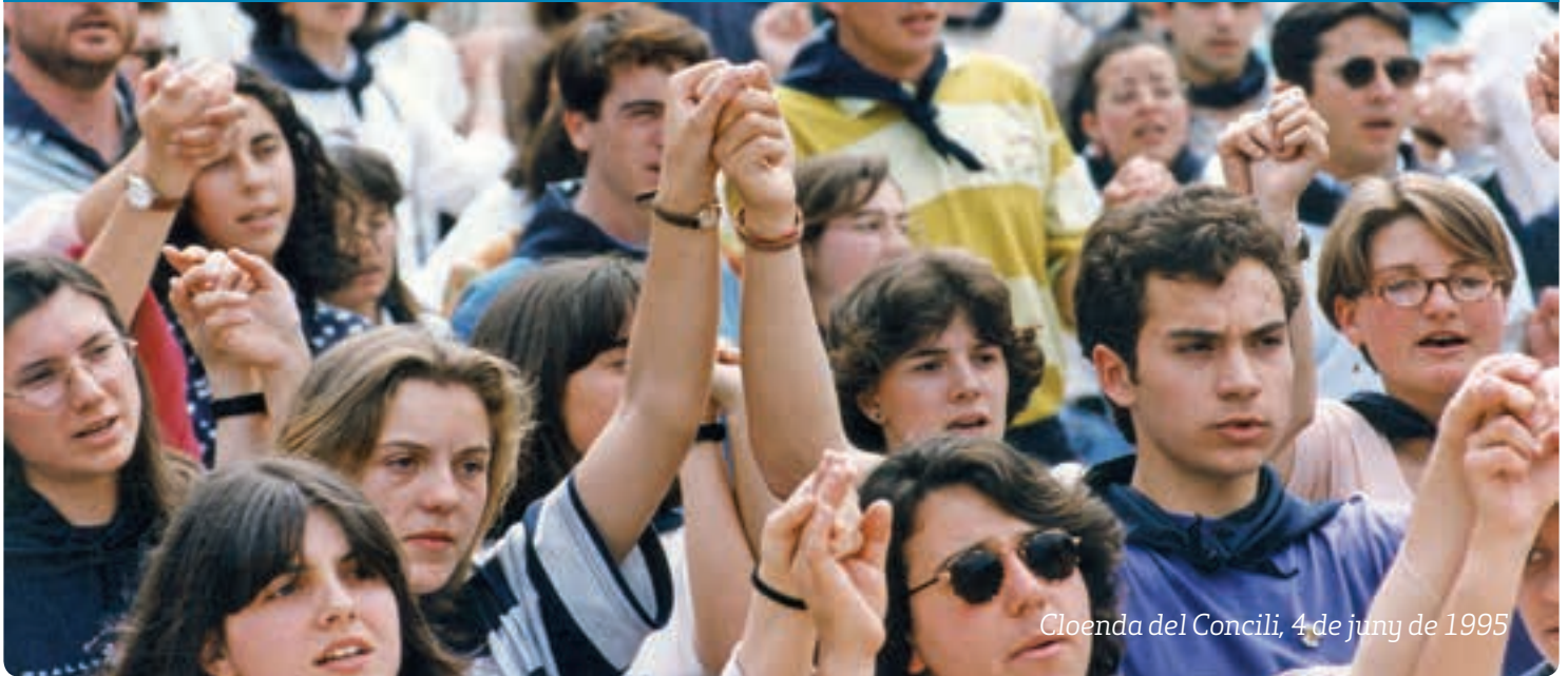
Cloenda del Concili, 4 de juny de 1995

p6 i p7 – Testimonis de persones que participaren en el Concili