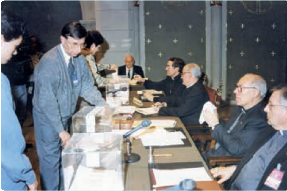
Obertura de les urnes després de les votacions dels temes