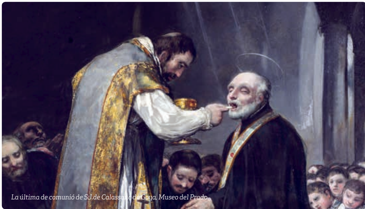
La última de comunió de S.J. de Calassanç de Goya, Museo del Prado