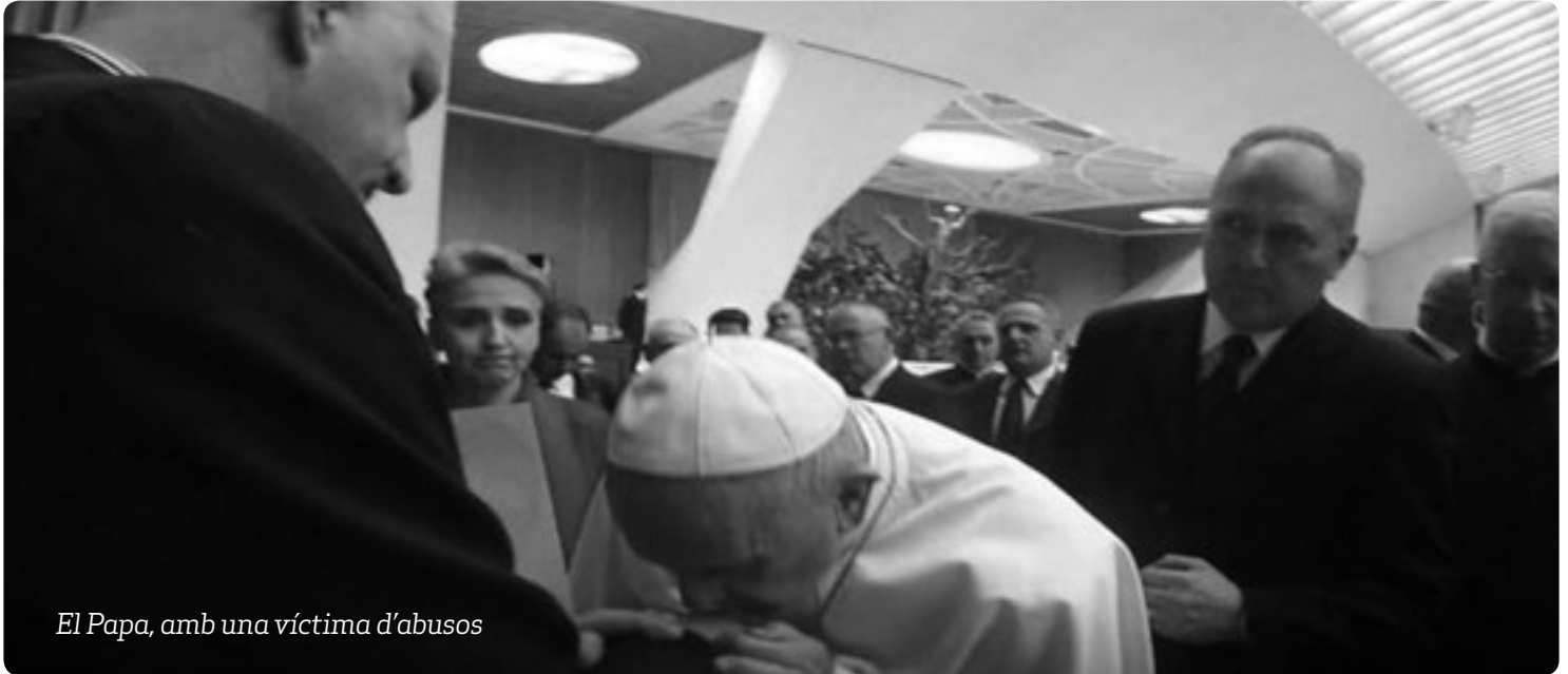
El Papa, amb una víctima d'abusos

Fins i tot «un sol cas d'abús» en l'Església «representa ja en si mateix una monstruositat» i «serà afrontat amb la serietat més gran». Alhora, «el ressò d'aquest crit silencios dels petits, que en comptes de trobar-hi paternitat i guies espirituals han trobat els seus botxins, farà tremolar els cors anestesiats per la hipocresia i pel poder». «Cap abús no ha de ser mai encobert ni infravalorat», insistí el Papa diumenge passat. I reiterà que «l'Església no es cansarà de fer tot el necessari per portar davant la justícia qualsevol que hagi comès aquests crims. L'Església mai no intentarà d'encobrir o subestimar cap cas».