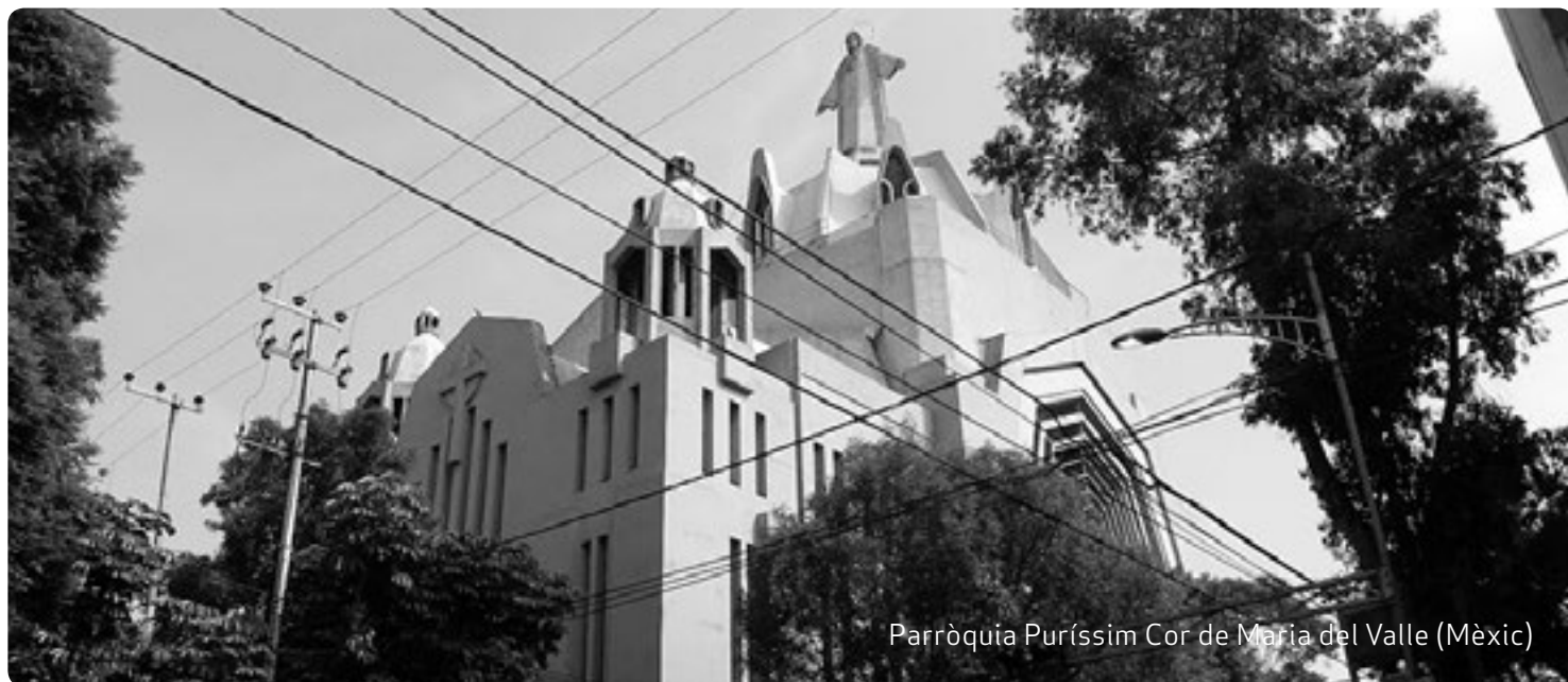
Parròquia Puríssim Cor de Maria del Valle (Mèxic)