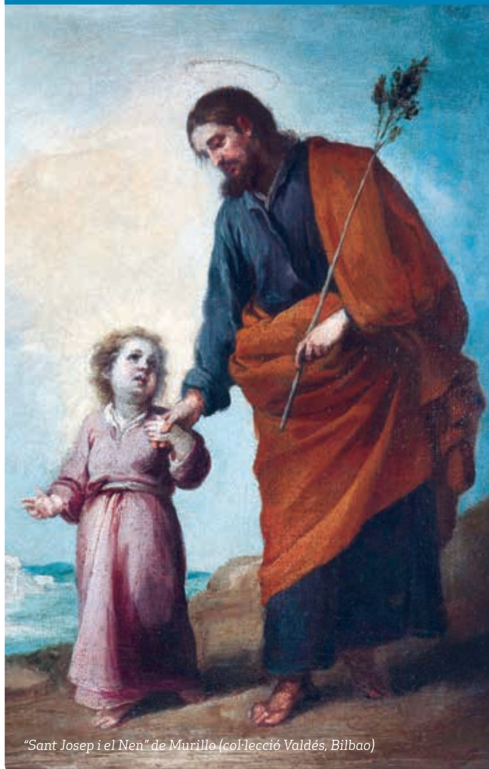
“Sant Josep i el Nen” de Murillo (col·lecció Valdés, Bilbao)

p6 – Sant Josep, patró dels fusters i dels pares