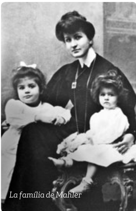
La família de Mahler

És en la Vuitena Simfonia –coneguda com la dels Mil, ja que requereix prop de mil intèrprets entre solistes vocals, coristes i instrumentistes per a la seva execució, a ple pulmó– on Mahler va descarregar enterament els seus afanys i propòsits espirituals. Després d'haver compost uns passatges solament per a l'orquestra, va sentir la necessitat de recolzar-se en un text, el de l'himne llatí «Veni, Creator