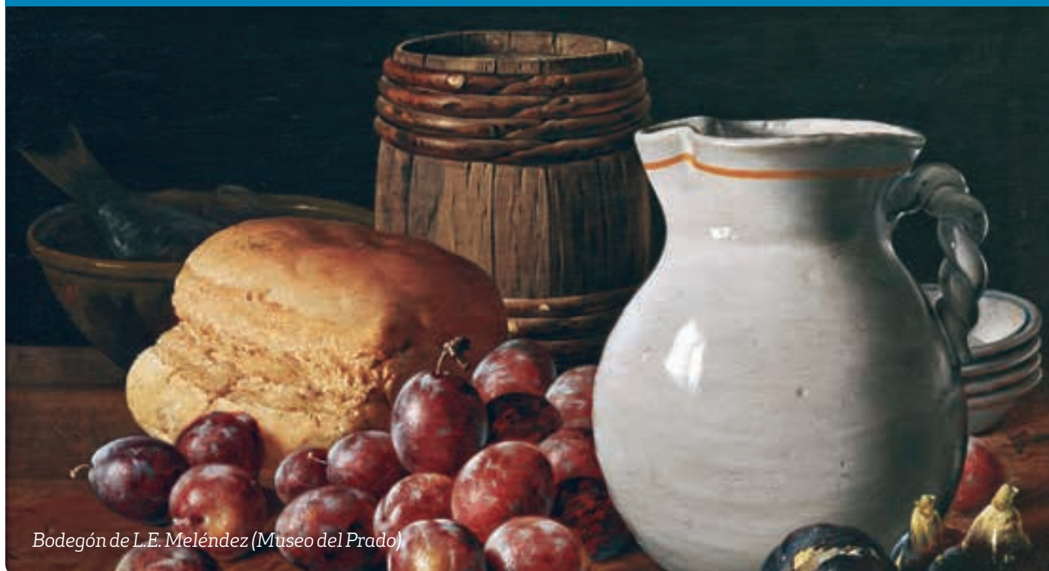
Bodegón de L.E. Meléndez (Museo del Prado)

p5 – Recés de Quaresma per a laics al Seminari