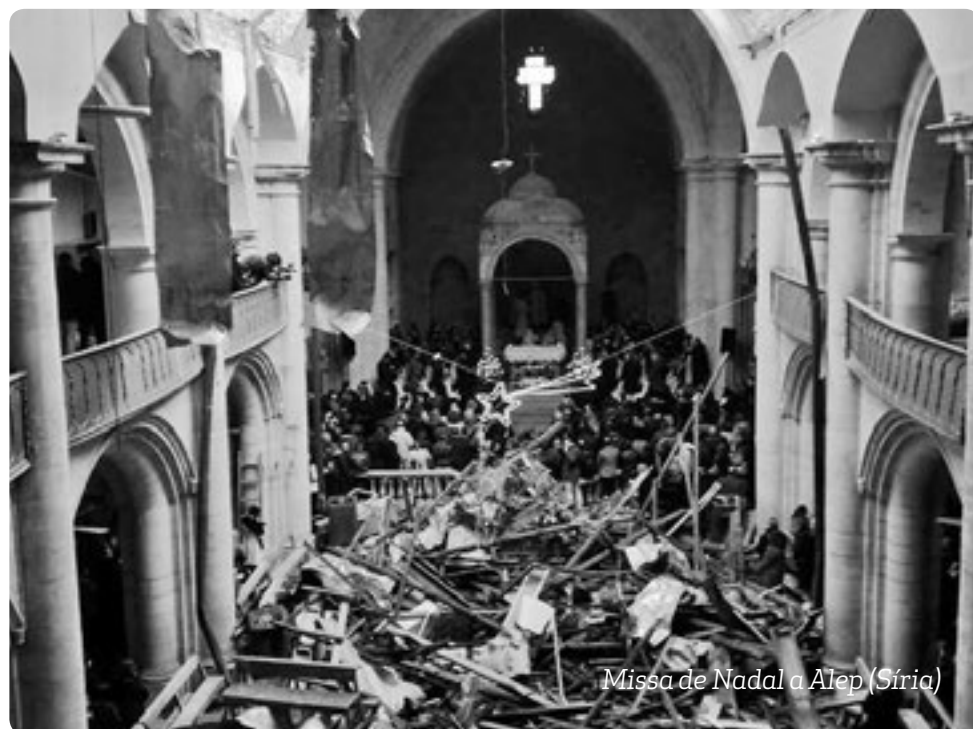
Missa de Nadal a Alep (Síria)

Francesc es va preguntar també els motius pels quals el món odia els cristians, i va oferir a continuació la resposta: per «la mateixa raó per la qual va odiar Jesús».