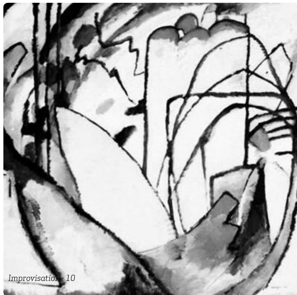
Improvisation - 10

Aquest mateix flux i reflux despunta una altra vegada en les primeres dècades del segle XX, quan Occident es trobava en la perplexitat i experimentava l'esgotament d'un sistema amb la Guerra de 1914, amb la Revolució Soviètica i amb el naixement dels feixismes. En aquest ambient brotaren moltes propostes «salvífiques», de vegades desbaratades, esotèriques o bé regeneracionistes, que postulaven de fer tabula rasa de tot, que reclamaven un retorn a les essències o un anar sempre més enllà. En aquestes propostes hi ha sempre, amagat en el fons, un instint religiós de mort i de resurrecció, de superar la finitud apostant per un Infinit desconegut. La visió de Kandinsky augurant amb el seu art l'establiment del «Regne de l'Esperit» no està gens lluny d'aquella profecia de Malraux: «Le XX e siècle sera mystique ou ne sera pas.»