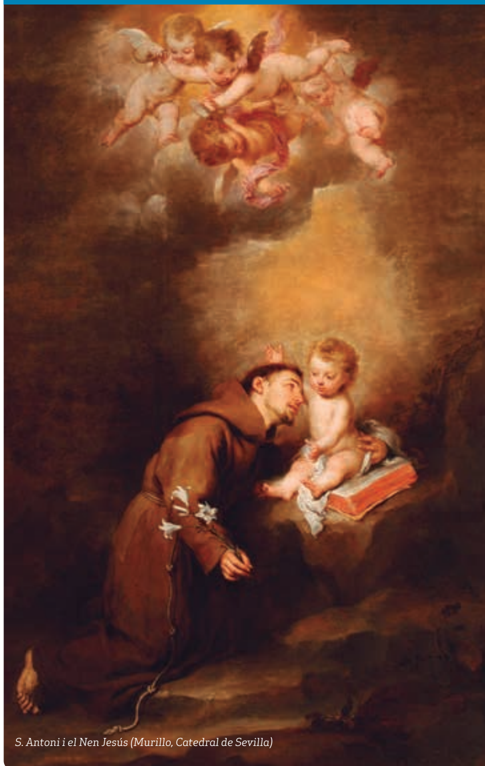
S. Antoni i el Nen Jesús (Murillo, Catedral de Sevilla)