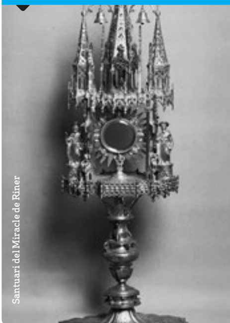
Santuari del Miracle de Riner