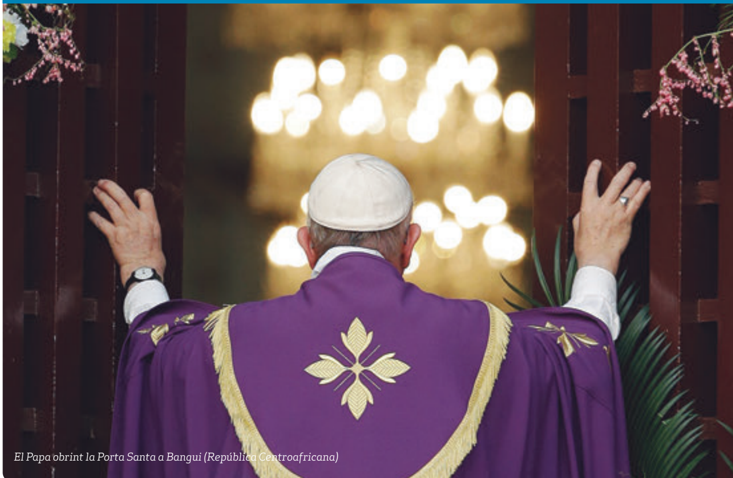
El Papa obrint la Porta Santa a Bangui (República Centroafricana)

p8 – "Capbussem-nos en el misteri de Nadal", glossa del bisbe